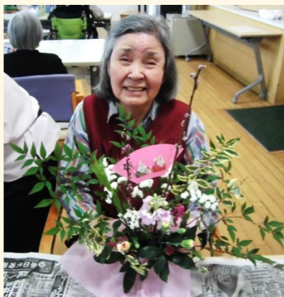
撮影時のみマスクを外していただいております。

フラワーアレンジメントの活動写真です♡ ご自身で活けた季節の花を目の前ににっこりと記念撮影☆ ティフロアもお花の香りに包まれて一足早く春がやってきました☆