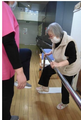
平行棒で足上げの運動！ 平衡感覚も大切です