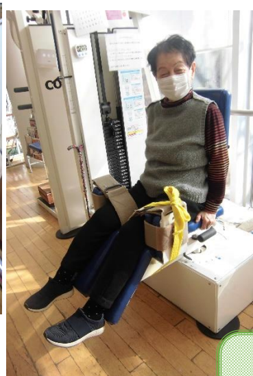
ヒップアブダクションで 臀部周辺の筋力アップ！