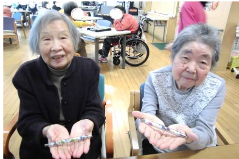
ボランティアの方による 押し花ボールペンづくりをしました

5月はデイフロアにこいのぼりを飾り、5日と6日はしょうぶ湯もおこないました。これからも皆様と季節の移り変わりを楽しんでいきたいと思ひます。