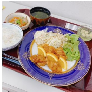
4月のイベント食は、唐揚げ祭り！ 柔らかいお肉がジューシー♪