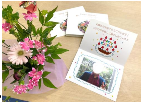
右は4月のお誕生日カード！ 左はフラワーアレンジメントの作品です🌸

5月はデイフロアにこいのぼりを飾り、5日と6日はしょうぶ湯もおこないました。これからも皆様と季節の移り変わりを楽しんでいきたいと思ひます。